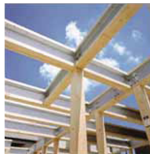
鉄の強さと木のしなやかさを組み合わせ、高い強度を誇る「テクノビーム」が、もしもの災害からもご家族を守ります。