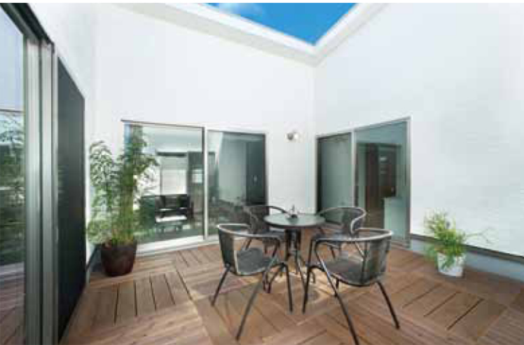
2階の中央をオープンエアの中庭に充てた大胆な間取り。家族がそれぞれの部屋にいる時にも、中庭越しに見える部屋の灯りが他の家族の気配を身近に感じさせてくれます。