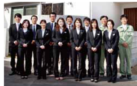
7年間の無料保証や毎年の無料メンテナンスなど数多くのサポートで、建てた後にもお施主様とスタッフとの間に信頼感のあるお付き合いが続きます。