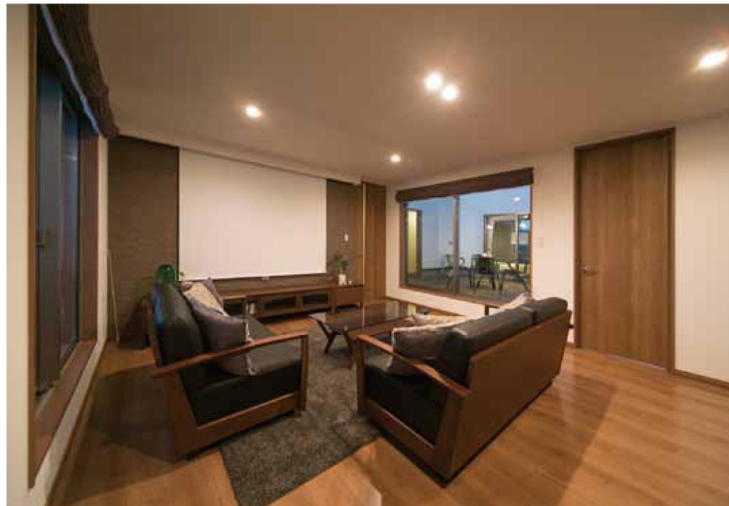
2階には、シアタールームを設け、お気に入りのソファに座り、家族でゆったり映画を楽しむ事ができます。

間取りだけでなく、木と鉄の良さを併せ持つ複合梁「テクノビーム」、セルローズファイバーの断熱材などの優れた素材も用いることで、家としての基本性能も充実。亀井組が建てる住宅の心地良さを、ここで体感していただけます。