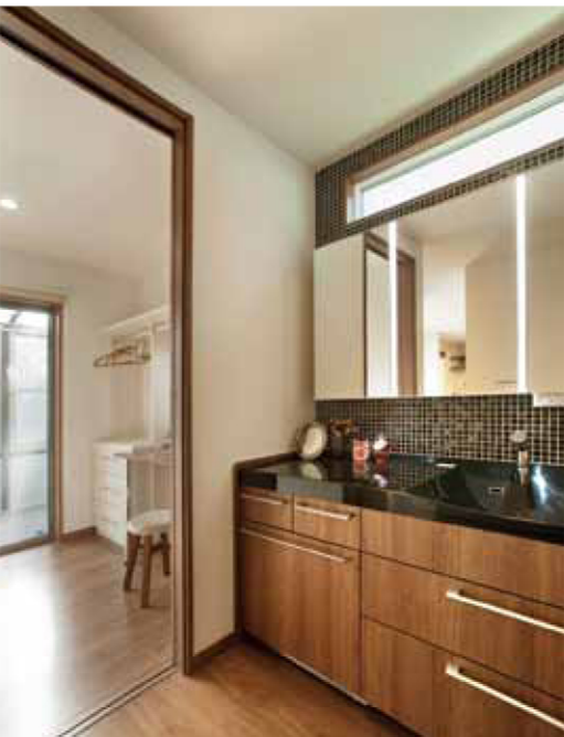
来客時にお客様が快適に使えるように、ドアをつけず、開放的な洗面室にしています。左側の家事室のドアを開けてスッキリ見せることもできます。