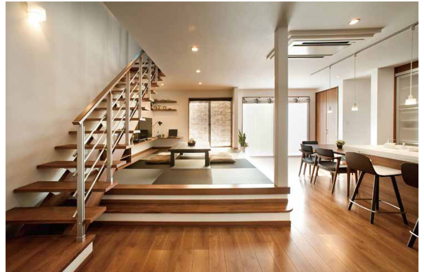
鳴門市斎田に完成したモデルハウス。亀井組の提案する現代の家に対する考えを結集したフラッグシップモデルとして、「亀井組にできるすべて」を表現しています。

●徳島本店 / 〒770-0941 徳島市万代町6丁目20-2 TEL.0800-200-1447 http://kamei-techno.com E-mail info@kamei93.co.jp