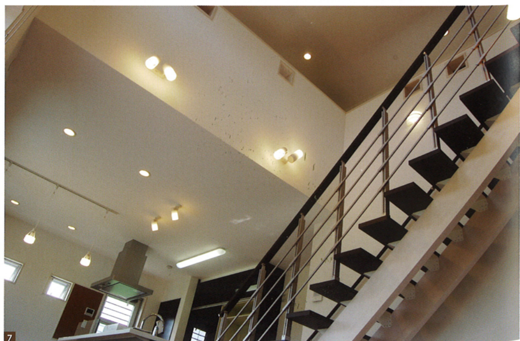
1 「家族とのコミュニケーションを大切にしたい」という施主様のリクエストから採用されたリビング階段。2 キッチンまわりはスッキリするように、独立型を採用。洗面室やお風呂などはキッチンからすぐ移動できるようプランニング。3 4つの小窓に落ち着いた壁紙を盛り込むことで、部屋のアクセントになっている。4 太陽光発電システムを搭載したオール電化仕様。毎月の電気代を軽減。5 広いリビングダイニングは、家族の憩いの場。キッチン前には大きな窓があり、料理をしながら外の景色を見ることができるようになっている。6 自然を感じられるように、玄関横の癒しの庭。緑のスペースを設けることで、より落ち着いた雰囲気となります。7 開放感のある広い吹き抜けを設け、家族の存在を感じられるようになっている。夜は間接照明で違った雰囲気演出。