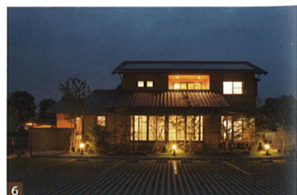
1 広いLDKだが、高気密高断熱により冬でも裸足で歩けるほどの暖かさを実現。そのため、大きな吹き抜けがあるが1階と2階の温度差はほとんどない。2 1階の寝室は将来の暮らし向きに備えプライベートなトイレや浴室などの設置も可能な仕組みになっている。3 最近少なくなった床の間に加え、幽玄な光の取り込みによって、落ち着いた空間づくりを実現した和室。4 和風テイストたっぷりの外観。懐かしい雰囲気にも包まれており人気が高い。5 二世帯住宅としても想定されており、子ども部屋は将来2部屋に分けられるよう広めに。6 部屋からあふれる光も落ち着いた雰囲気。