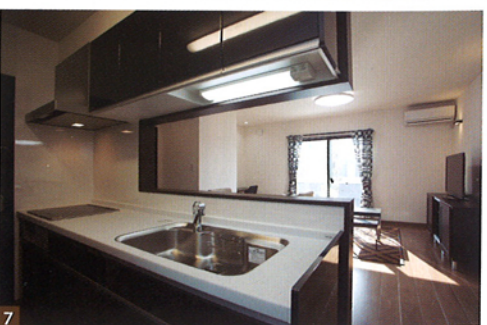
1 家族が自然と集まるリビング・ダイニング。部屋の一角に設けた書斎コーナーは、読書やインターネットを楽しむだけでなく、お子さまの勉強スペースとしても利用できます。2 住まいの顔となる玄関。アプローチからの姿は威風堂々としたたずまい。3 キッチン・リビングに隣接する和室。客間としての機能はもちろん子どもの遊び場として使えるなど、用途はいろいろ。4 子どもの成長に合わせて自在にコーディネートできるようにシンプル設計に。5 自由設計なので外観もお好みのカタチに。写真は一例です。6 疲れた心身を癒してくれる、落ち着いた雰囲気の主寝室。7 家族を見渡せるキッチンで、食事の支度をしながらおしゃべりも楽しめる。家事がスムーズにできるように、奥さま好みに家事動線をご提案します。