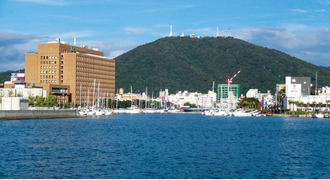
万代町…徳島県庁があることでも知られる街。中でもケンチョピアは全国的に見ても珍しいヨットハーバーとして知られる。