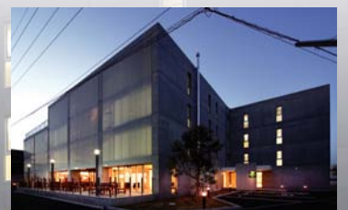
コレクティブハウスなじみ