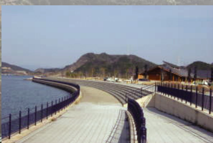
鳴門ウチノ海総合公園