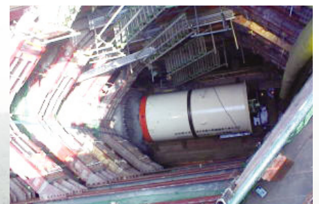
旧吉野川幹線建設工事