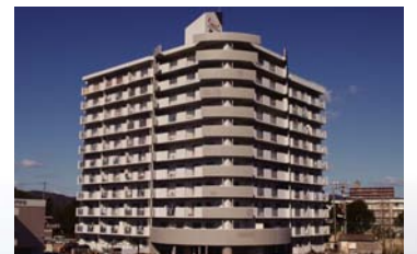
リバレインマンション勝占