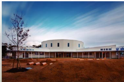
ピーンスターク保育園 とくしま