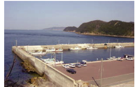
漁港改修・瀬戸漁港

为了人与自然环境的和谐共存，今后我们将继续以可靠的技术建设安全安心的社会发展基石。