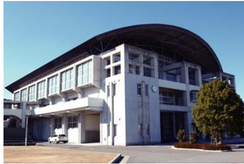
徳島県立鳴門高校 体育館