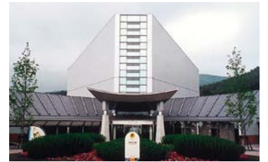
あすたむらんど徳島 四季彩館